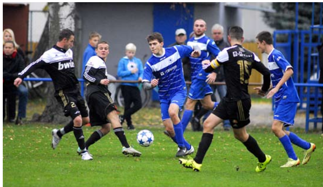
V jednom z podzimních zápasů se potkaly Pardubičky (v modrém), které v loňské sezoně sestoupily z krajského přeboru, a nováček z Libišan. Právě hosté získali v Pardubičkách svou desátou výhru v ročníku.

Jeho tým na podzim ztrácel body i v domácím prostředí. Na svém hřišti jich získal 8, méně úspěšně již byly jen celky Zámrska a Horního Jelení. „Je však pravda, že z dlouhodobějšího hlediska se nám vždy dařilo vozit v uvozovkách nečekané body z venku. Těch ukazatelů, proč to tak je, je více. Nechtěl bych se ovšem pouštět do rozboru příčin. Snad jen dodám, že je mou chybou, že jsem hráče nepřesvědčil k lepšímu přístupu ke všem činnostem.“