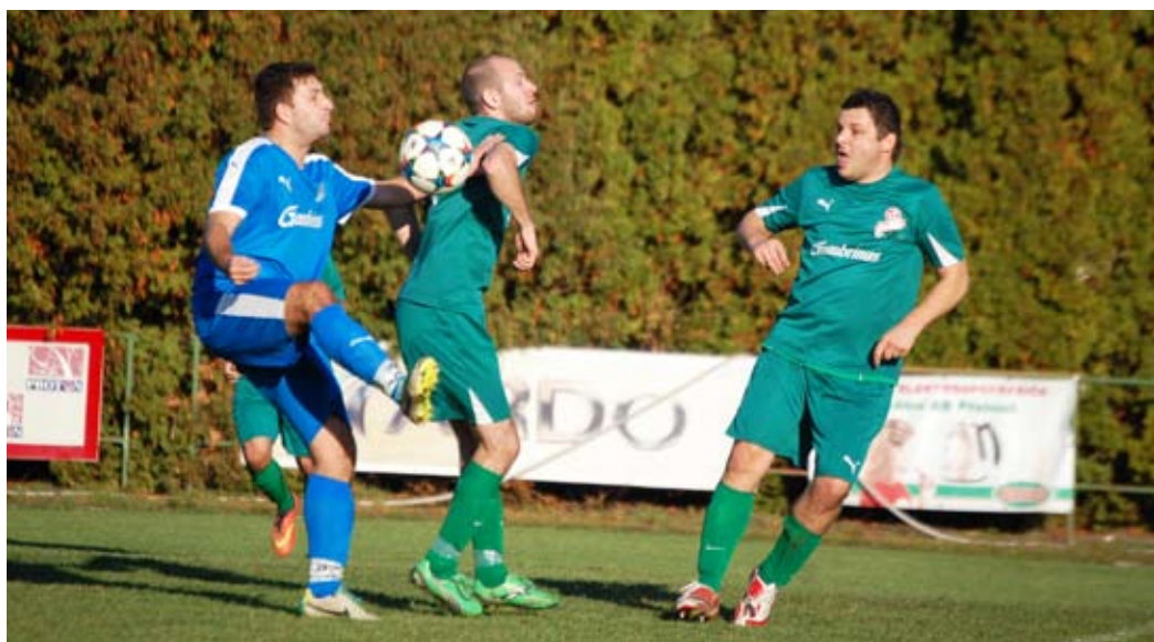
Hráči rezervního týmu Přelouče (v modrém) v duelu celků ze spodních pater tabulky doma udolali Křižev. Oba týmy v jarních odvetách čeká boj o záchranu.