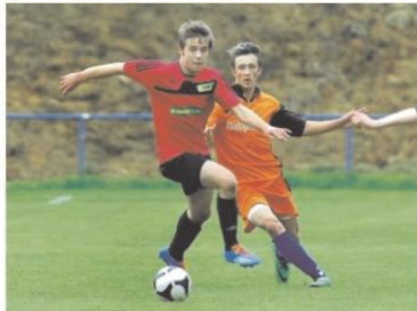
Ze vzájemného duelu Pardubic s Českou Třebovou, ze kterého vyšel vítězně vedoucí celek tabulky.

FK Agria Choceň - SK Holice 1:1 (1:1). Branky: 29. Šabata - 43. Kopriva z penalty. Rozhodčí Kotyza. ŽK: 2:5. ČK: 1:0 (40. Gerčák). Diváky: 150. HOLICE: Zahradník - Růžička, Ručka, Hanč - Kopriva - Krpata, Chvála, Denk (70. Starý), Klouček - Václavěk (86. Strachota), Jiráský (75. Michalec). Domácí soupeři s Českou Třebovou o první příčku tabulky a tentokrát to neměli lehké. Ve 20. minutě jim penalový faul ve vápné odpuštěl hlavní arbitr utrápný a na první ohrožení holické branky se domácí zmohli až ve 23. minutě a to ještě po pohybu Denka. Ve 29. minutě ale poprvé udeřilo. To po akci Hrubého skóroval Šabata a domácí vedli 1:0. Jenže přišla velká komplikace. Ve 40. minutě fauloval ve vápné choceňský gólmán Gerčák Václavka, nařízen byl pokutový kop a mezi tyče se z lavičky postavil Trkal. Kopriva penaltu bezpečně proměnil