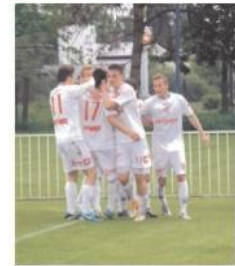
Radost pardubičských mladíků po prvním vstřeleném gólu v zápase s Opavou.

Celostátní liga dorostu U19: FK Pardubice - Opava 2:1 (2:0), Valenta, Uhlíř. PCE: Stejskal - D. Pánek, Kejmar, Kopecký, F. Pánek (65. Molek) - Bydžovský, Kovář (30. Málek), Špidlen, Uhlíř (75. Řehák) - Valenta, Prazák (70. Formáček). Utkání soustředěni v tabulce. První půle z pohledu domácích lepší než druhá, ale důležité vítězství se podařilo doslova ubojovat. Brno - FK Pardubice 4:0 (2:0). Přístě: Pardubice - Slovácko (so 13).